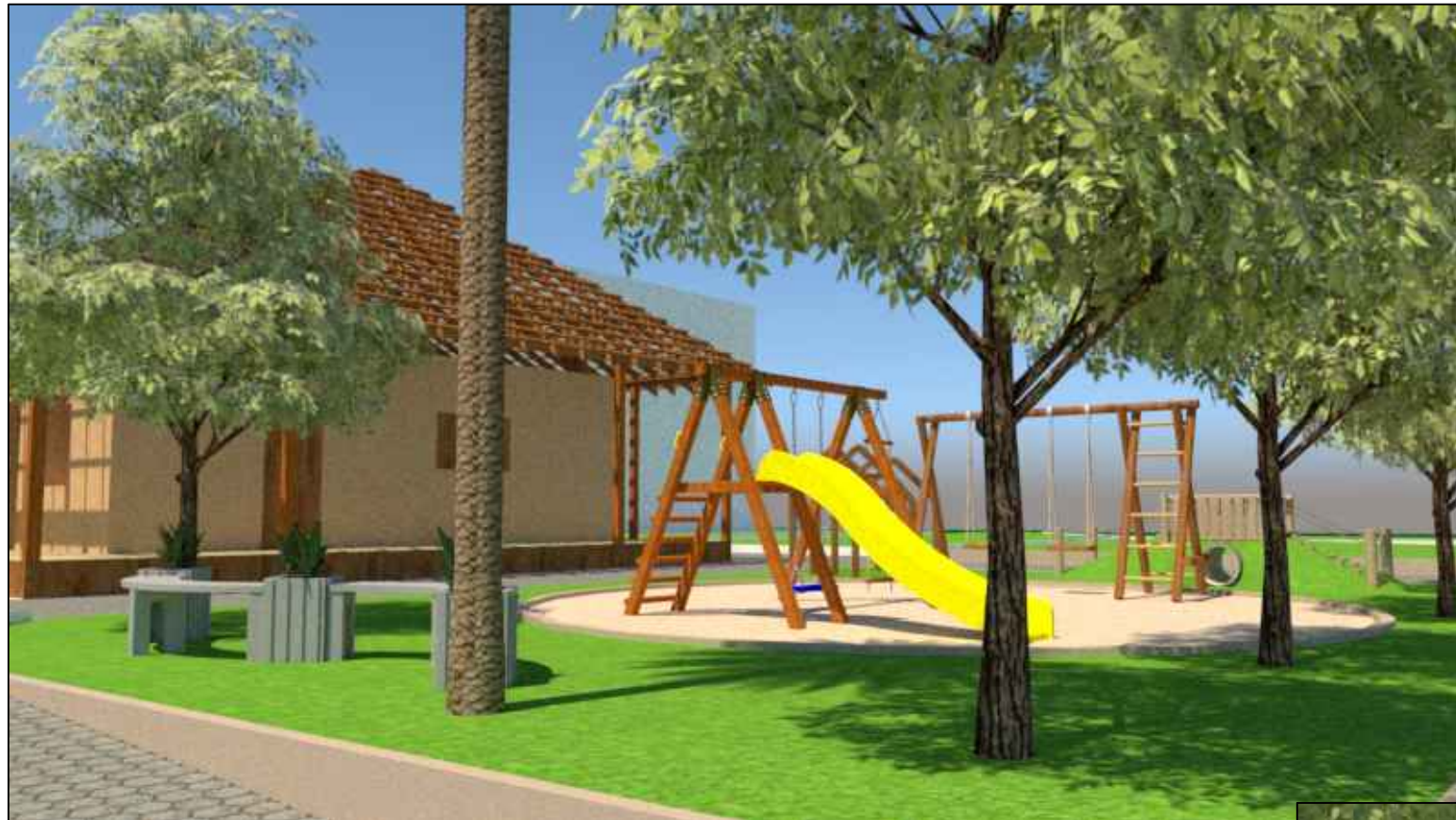
ELEMENTO DE MADEIRA EM FORMATO DE CASINHA